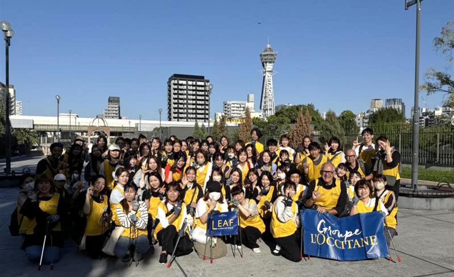
オフィス、店舗スタッフが一丸となつての取り組んだ