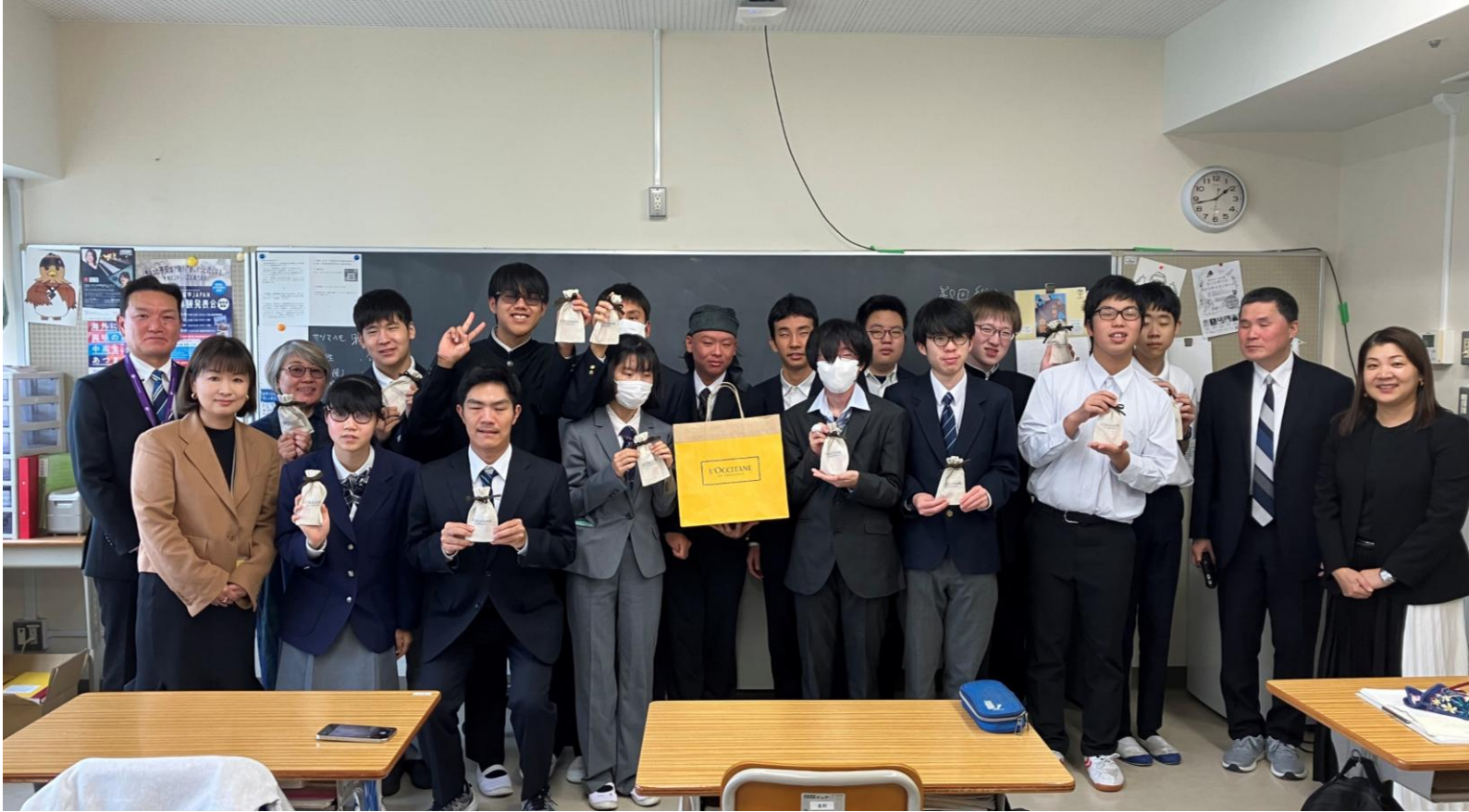
筑波大学附属視覚特別支援学校にてハンドクリームを訪問し、寄贈。