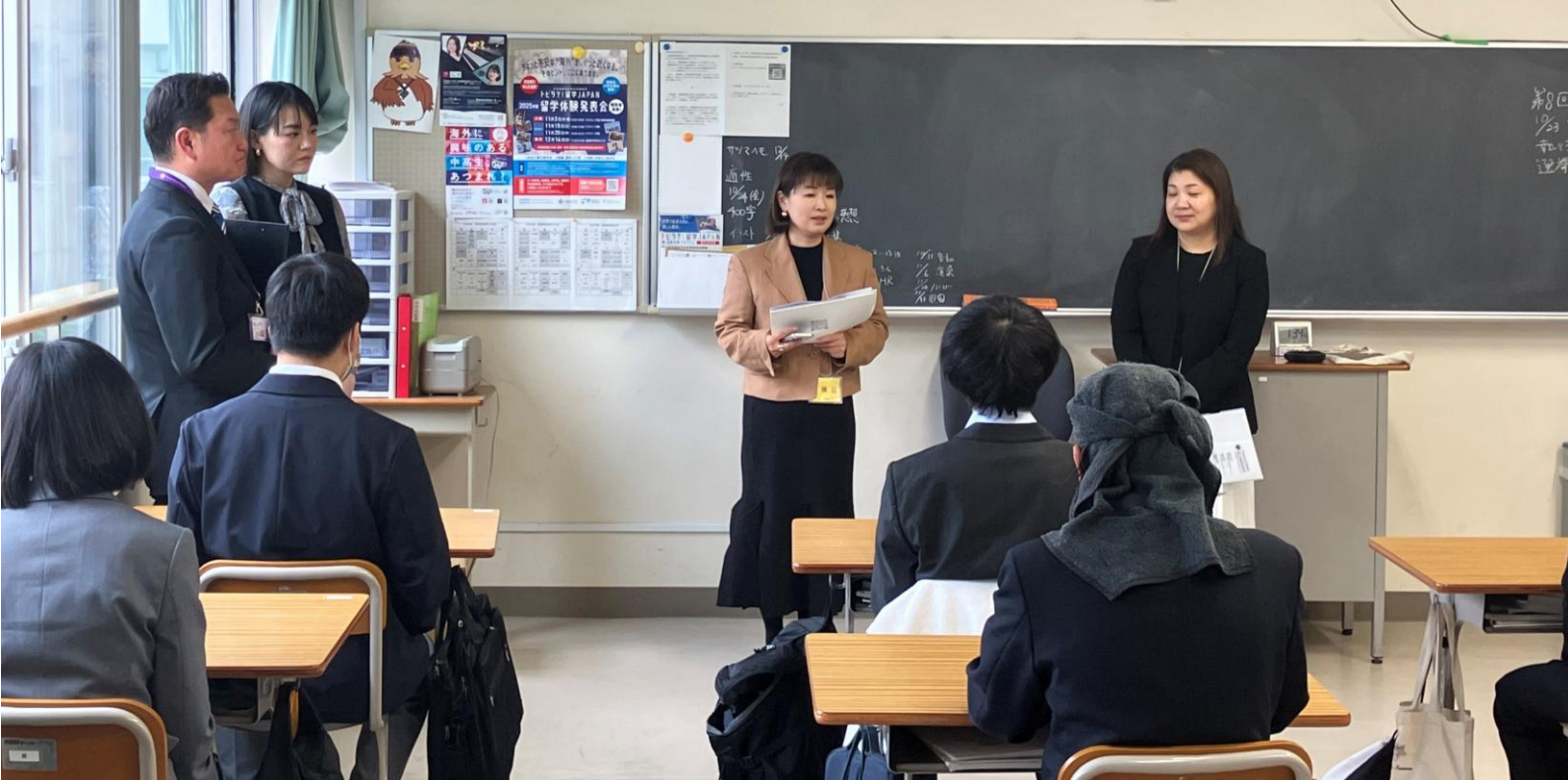
(上・下)視覚特別支援学校の皆様にロクシタンの取り組み、想いを熱く伝える様子